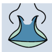
Fente labiale bilatérale complète