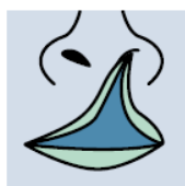
Fente labiale unilatérale complète