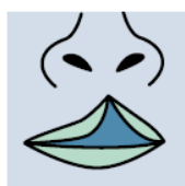
Fente labiale unilatérale partielle

Ces enfants ne peuvent habituellement pas avoir recours à la chirurgie du fait des coûts beaucoup trop élevés pour la majorité des familles. C'est le sens des interventions de Médecins du Monde que de proposer gratuitement ces opérations afin de redonner le sourire aux enfants et favoriser leur réinsertion au sein de leur communauté. Les interventions chirurgicales de fentes sont représentées par des opérations du voile, du palais, des fentes palato-vélaires ou des fentes complètes (lèvres, voile et palais).