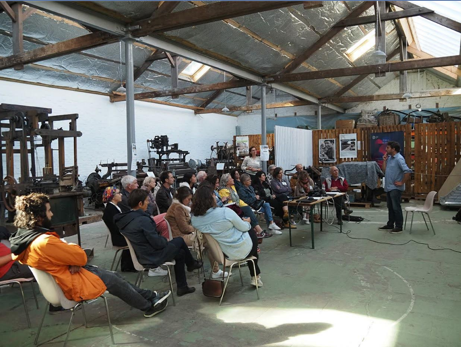
Session de présentation Normandie Sept. 2023