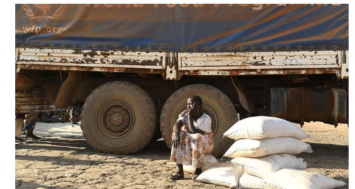
Uma mulher vítima de deslocamento forçado se senta ao lado de um caminhão do Programa Mundial de Alimentos, na cidade de Bemlo, no Sudão.

Desde o início de 2023, pelo menos 62 trabalhadores humanitários foram mortos em todo o mundo, revelou nesta quinta-feira (17) as Nações Unidas, que se preparam para lembrar os 20 anos do sangrento ataque contra sua sede em Bagdá. Todos os anos, a ONU celebra o Dia Mundial da Ajuda Humanitária em 19 de agosto, data desse atentado suicida que vitimou 22 pessoas, entre elas o diplomata brasileiro Sergio Vieira de Mello, representante especial da ONU no Iraque.