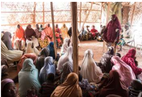
Projet MdM au Niger

A partir de septembre/octobre, MdM lancera un nouveau programme au Niger , pays où nous sommes déjà présents depuis 2015 avec deux projets (auprès des migrants à Agadez et auprès des populations nomades à Ingal et dans sa région). Avec Vétérinaires Sans Frontières, nous lancerons un programme de réduction des risques afin de réduire la vulnérabilité des communautés aux risques d'épidémies, d'épizooties (épidémie qui frappe les animaux) et aux risques sanitaires découlant des chocs climatiques (inondations, sécheresses, etc). Mais ce programme vise également à faire le lien entre santé humaine et santé animale (concept du « One Health »), visant une population en majorité d'agriculteurs.