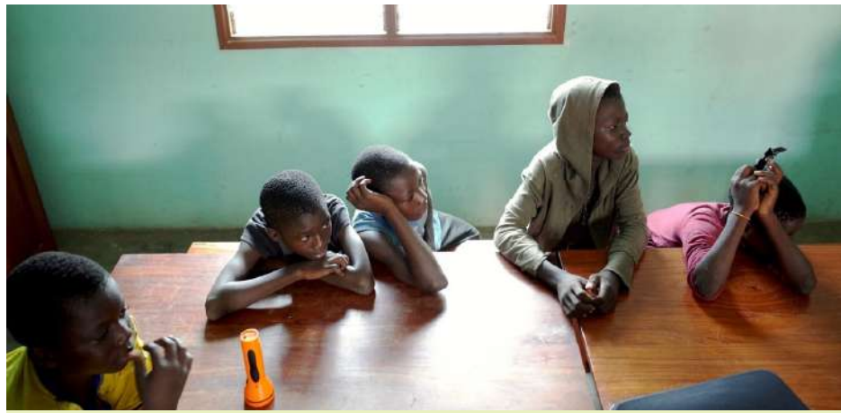
Bénin - Centre d'accueil et dortoir de nuit

sion de définition de besoins au Burundi . Notre objectif est de soutenir le Centre Seruka - déjà en activité - dont la mission est d'éradiquer les violences sexuelles et basées sur le genre en garantissant l'accès aux soins, à la justice et à l'information aux victimes et à la communauté. Notre mission aura pour objectif de construire un partenariat et d'identifier leur besoin.