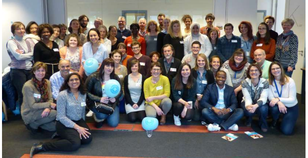
Quelques bénévoles du Plan Hiver lors de la Soirée clôture, qui s'est déroulée le 26 avril.

Nous sommes médecins. Nous sommes infirmiers ou infirmières. Nous sommes accueillants ou accueillantes. Mais nous sommes aussi pédicures et masseurs. Tous bénévoles pour Médecins du Monde, nous avons passé ces six derniers mois dans les centres d'hébergement d'urgence du Plan hiver à Bruxelles à offrir des soins médicaux à ceux qui en avaient besoin. Aujourd'hui, ce Plan hiver se termine, et nous ne pouvons pas rester silencieux.